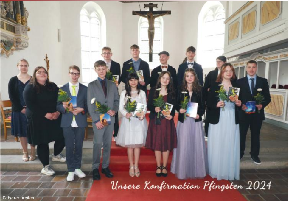
Unsere Konfirmation Pfingsten 2024